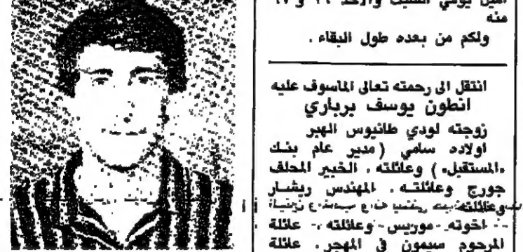
مجلسه مرور اربعين يوما على استشهاده

مجلسه مرور اربعين يوما على استشهاده. استشهاده الماسوف على شبهه النقيب في الجيش.